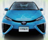
「自動車の 次の100年のために」