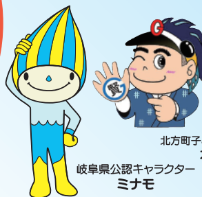
北方町子ども応援キャラクター ガタロー君 岐阜県公認キャラクター ミナモ