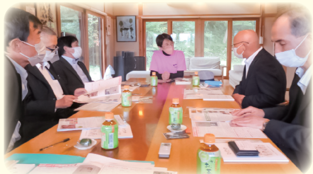
飛騨高山わらべうたの会にて

アスパラガス栽培において安定した収益をあげるようになった経緯と努力の過程を伺いました。