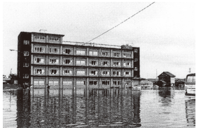
昭和51年9月12日の水害時の高屋丸の内付近

町では岐阜地方気象台との連携を強化し、町長とのホットラインも整備済みです。また、岐阜大学等と連携し、地域防災力の強化に取り組んでいます。気象防災アドバイザーの活用については、必要に応じて検討していきます。