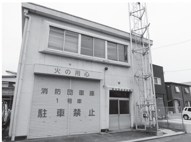
▲消防会館（旧庁舎西）

消防会館は、災害時には消防団員の参集場所や活動の拠点として、平常時は消防団員の教育・訓練の場や各種会議の実施場所として活用され、消防団の活動にとって重要な役割を果たす施設です。その整備については、現在進めている本巢消防署北方分署の建設計画と併せて検討したいと考えています。