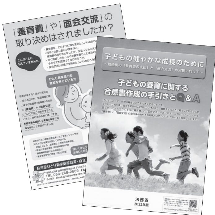
▲養育費等のパンフレット例

町ではこれまで、ひとり親家庭等の相談に対し、必要な支援が受けられるよう支援機関につないでおり、今後も国や県の動向を注視しつつ、岐阜地域福祉事務所との連携を密にして、必要な方に支援が届くよう適切に対応していきます。