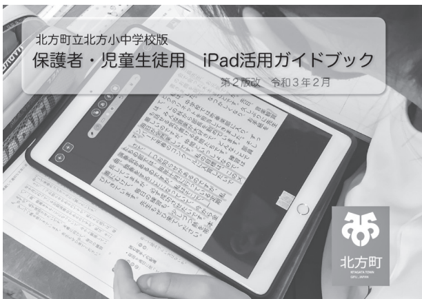
▲使い方とルールが書かれた資料 (貸与用タブレットに入っている)

児童生徒に貸与しているタブレットは、「20分経ったら休憩する」など具体的な指導を行っています。一方、オンラインゲームは夢中になりやすく長時間使用につながっています。眼の健康を害する要因に対しては、家庭と連携し、外で過ごす時間を増やすなど、眼の健康を守る取り組みをしていきます。