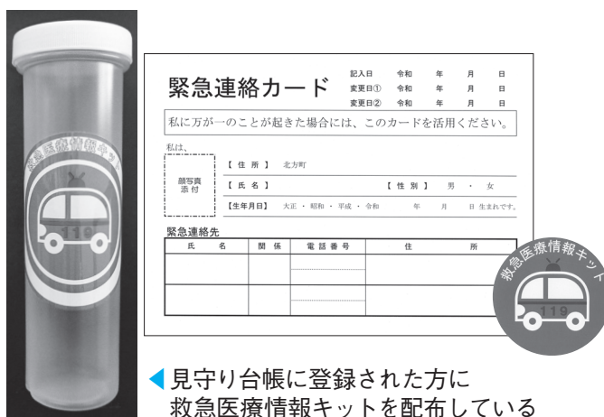
見守り台帳に登録された方に救急医療情報キットを配布している

大規模災害時に広域応援を迅速かつ円滑に遂行するため、県内全ての市町村と災害時相互応援協定を、岐阜圏域の9市町と越境避難に関する協定を締結しています。また、県は全国の都道府県と協定を締結しており、現時点で個別に締結する必要はないと考えていますが、今後、必要に応じて検討します。