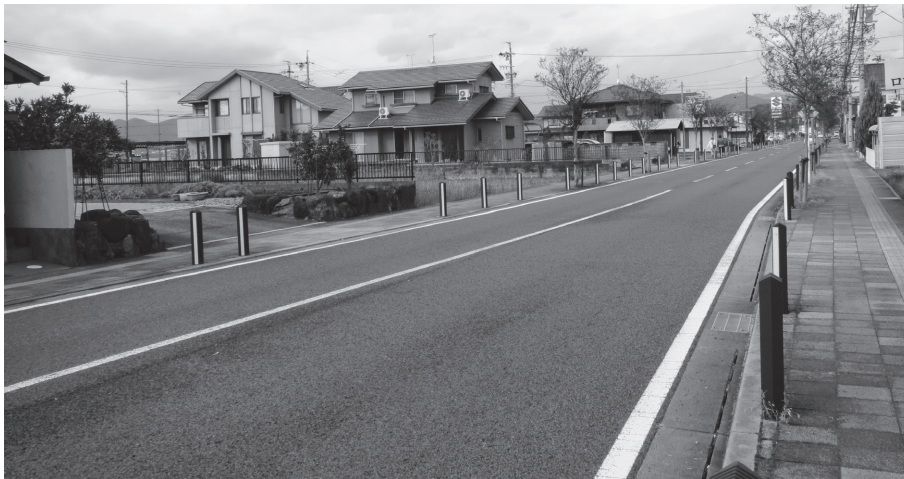
町道3号線(グリーン通り)北部

町道3号線は全区間で歩道を整備し、縁石や鋳物製のポール等により歩車分離され一定の安全性が確保されていると考えますので、現時点でガードパイプの設置は考えていませんが、今後、周辺環境や交通環境等の変化がある場合には、適切に対応していきます。