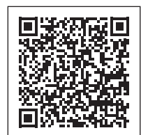
コロナ禍による厳しい 財政状況に対処し 地方税財源の充実を 求める意見書