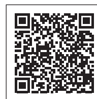
こども庁の設置を 求める意見書