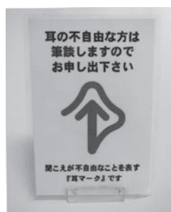
役場窓口の耳マーク

現在、総合窓口には「耳マーク」を掲示していますが、各課の窓口にも「筆談希望」のプレートを早急に設置します。