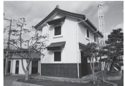
条里公園内防災倉庫

問 緊急避難連絡所である北方西小学校に代わる場所として、きらりホールを予定していますか。