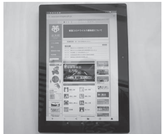
一般的なタブレット