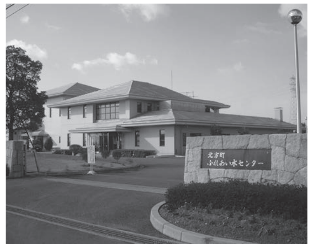
ふれあい水センター

上水道水源地は6時間、「ふれあい水センター」は18時間稼働可能です。燃料の備蓄は、燃料の品質保持の観点から町独自の備蓄が難しく、その代わりに被災時でも安定供給をしてもらうため、平成26年4月に町内の燃料販売店と「災害時における燃料等の優先供給に関する協定」を締結し、協力を要請することとしています。