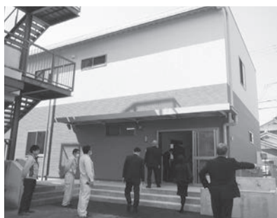
新設放課後児童クラブ棟