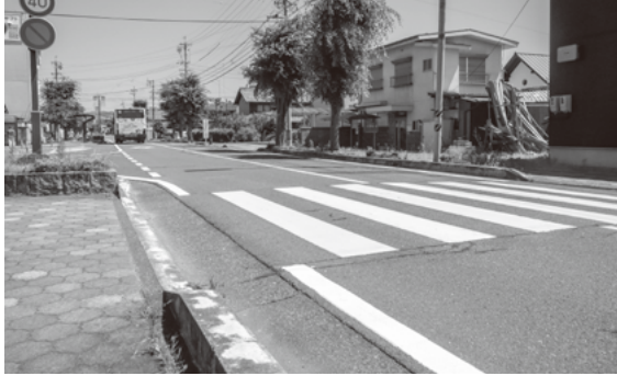
バスターミナル南東の交差点

① 4月19日、警察等関係者ととともに現場検証後、協議を行い、区画線(外側線、巻き込み)の設置や自発光鋲を2箇所を設置、注意喚起看板を新たに2基設置することにしました。