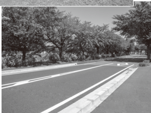
清流平和公園(上)と清流通り(下)

問 北方町総合戦略に定めた各KPI(重要業績評価指標)のフォローアップ実績と重要業績評価指標の達成状況について尋ねます。