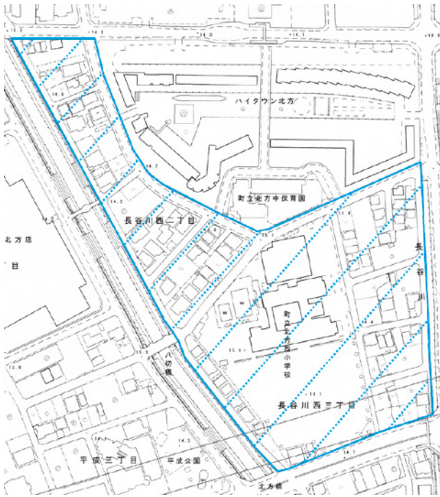
北方西小学校周囲のゾーン30

カラー塗装等による速度抑止策や当該地区のパトロール等の安全対策を講じています。 ②過去3カ年において物損事故18件、人身事故1件発生しておりますが重大事故がないことから、一定の整備効果は出ていると考えます。 ③この度、北方西小学校の周囲について指定を受けることになりました(左図)。広報誌、HP等で周知を行っていきます。