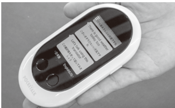
手のひらサイズの自動翻訳機

*岐阜県在住外国人相談センター：生活に係る相談に多言語で対応し、適切な情報提供及び関係機関への取次ぎをワンストップで行う機関。5月30日に開所。