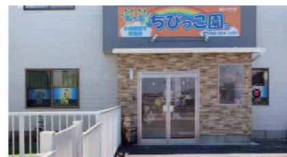
ちびっこ園 TEL324-1101 住所／高屋白木1丁目55番地の2

問い合わせ先 北方町役場 福祉子ども課 TEL 058-323-1119 北方町教育委員会 TEL 058-323-1115 北方町ホームページ http://www.town.kitagata.gifu.jp