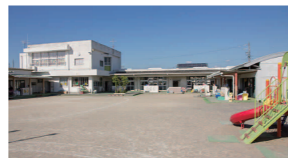
南保育園 TEL324-0611 住所／高屋勅使1丁目52番地