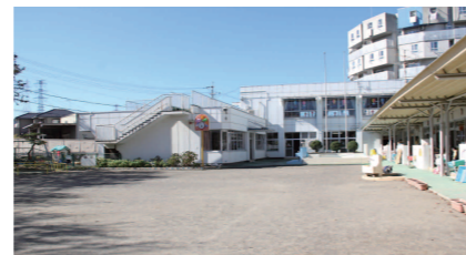
中保育園 TEL324-8313 住所／北方1857番地の3