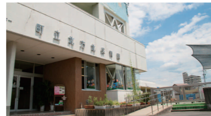
北保育園 TEL324-0254 住所／北方1640番地の1